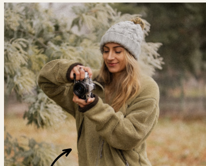
Pauline Bazeaud - Photographe

Ce workshop est bien plus qu'une série d'ateliers. Il est enrichi de moments uniques qui rendent l'expérience encore plus précieuse.